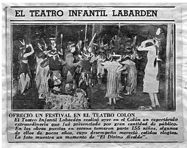
Imagen 3: Recorte de artículo del diario La Razón (6-12-1943).