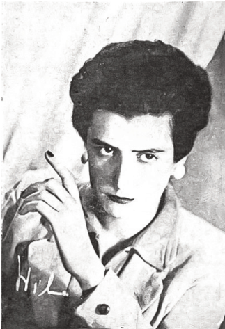
Imagen 1: