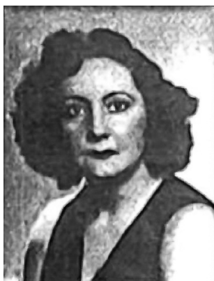
Imagen 13:

Nació en Buenos Aires en 1905 y murió en 1978. Estudió piano con Eduardo Melgar en el Instituto Musical Fontova de Buenos Aires, luego composición y orquestación en el Conservatorio Nacional. En 1951 recibió una beca para estudiar folclore en el norte del país, otorgada por la Comisión Nacional de Cultura; en 1960 la OEA le otorgó otra beca para estudiar el movimiento coral en Chile. En 1961 fundó la Organización Musical Premio Carlota M. P. de Calcagno (el nombre de su madre) con el fin de estimular las carreras de instrumentistas jóvenes. Trabajó en escuelas del Consejo Nacional de Educación durante 25 años y gran parte de su producción creativa fue desarrollada en ese ámbito. Además, como compositora tuvo una vasta creación en todos los géneros, que fue catalogada y gran parte analizada por Silvina Mansilla (2001; 2005), quien también escribió su entrada léxica en el Diccionario de la Música Española e Hispanoamericana (2002: 908). Carrascosa (2016) analizó sus piezas para piano y Lobato (2012, 2021), sus aportes como crítica musical en la revista La Mujer . También es mencionada en el Diccionario biográfico de mujeres argentinas , de Sosa de Newton (1980: 80), y en el libro de Frega (2011: 63).