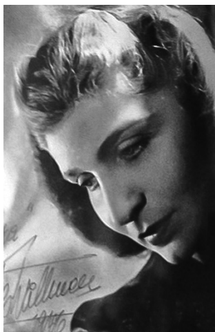
Imágenes 4 y 5: Margarita Wallmann en Lyra 39 (IV), octubre de 1946.